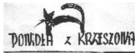
rys. H. Pisula

Upadek Krzeszowa w.. Spinoza z ulicy Rynkowej, przeł. Monika Adamczyk Garbowska, ATEXT, Gdańsk 1995