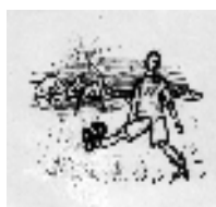
rys. H. Pisula