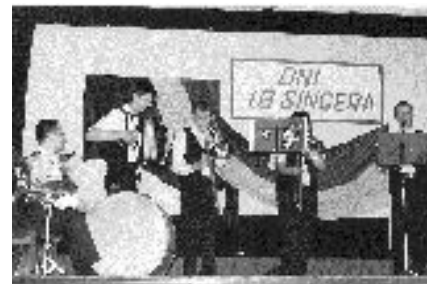
Hoyzn Klezmerim w GOK Krzeszów