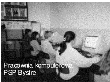
Pracownia komputerowa PSP Bystre

W minionym roku udało się zakupić 4 komputery do pracowni, wymienić część okien w salach lekcyjnych. Ogłoszono również przetarg na wykonanie dokumentacji technicznej w związku ze zmianą dachu nad budynkiem