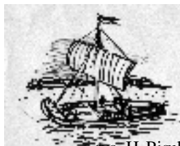
rys. H. Pisula

klas jest następująca (od najlepszej): III b, Ia, IIa, Ic, IIIa, Ib, IIc, IIb, IIIc. W szkole działa się bardzo wiele dobrze. Poszerzenie oferty dydaktyczno-wychowawczej szkoły stanowią realizowane dodatkowe programy, przeprowadzone apele o różnorodnej tematyce, nadawane audycje radiowe i okazjonalne