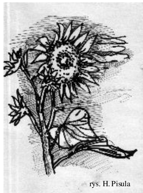
rys. H. Pisula